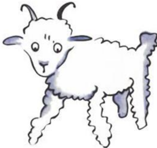
Figure 2 κριάρι