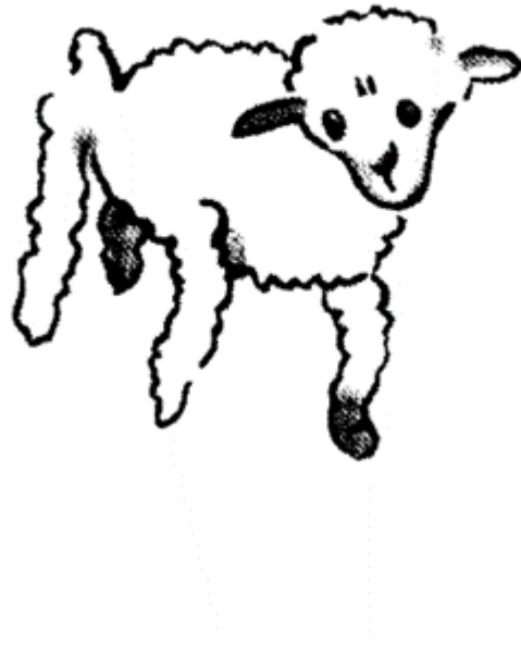
Figure 3 γέρικο