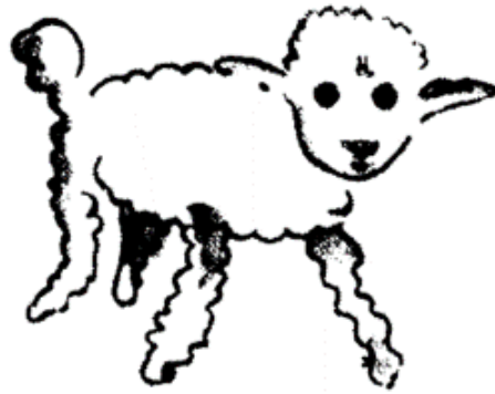
Figure 1 άρρωστο

Εικόνες του Εξυπερύ για την αφόρμηση της δραστηριότητας –Υλικό για εκτύπωση